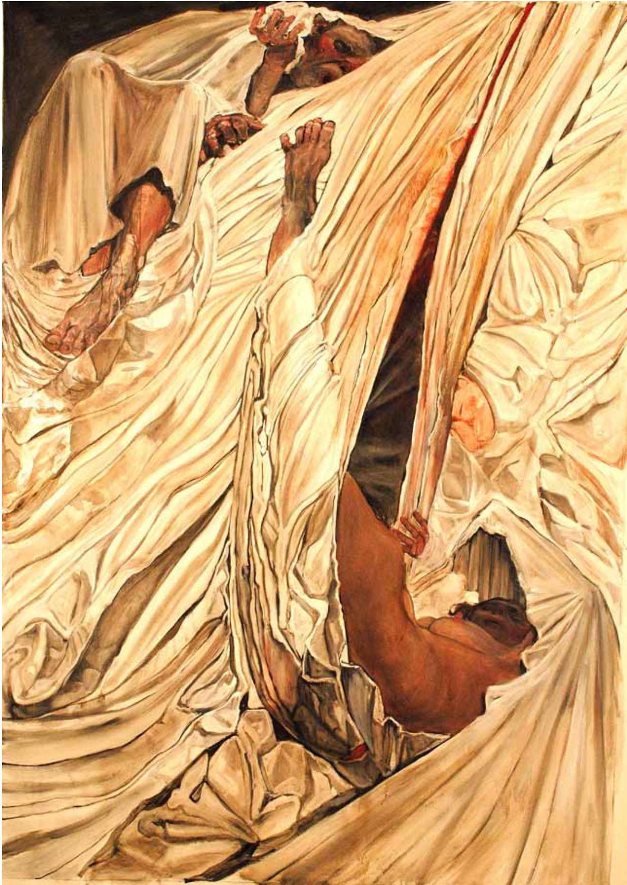
12 Com'è Stato Possibile Perdersi in Questo Universo oil on canvas 200 x 160 cm (79 x 63 in)