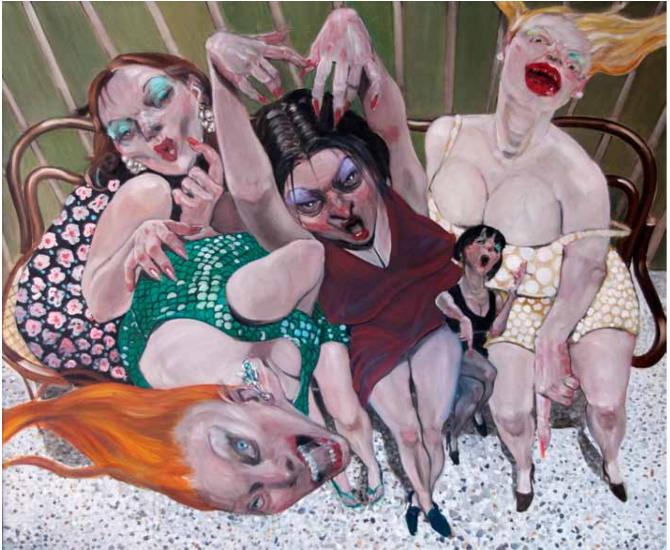
7 Le Sirene oil on canvas 100 x 120 cm (39 x 47 in)