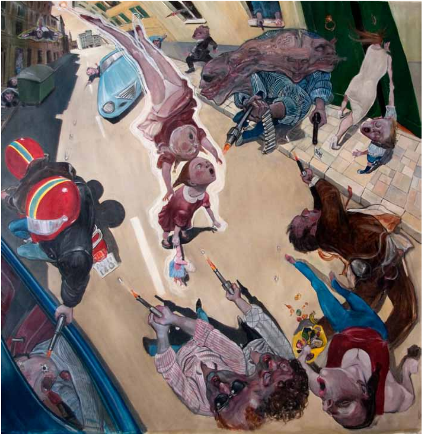
10 Video Game oil on canvas 200 x 200 cm (79 x 79 in)