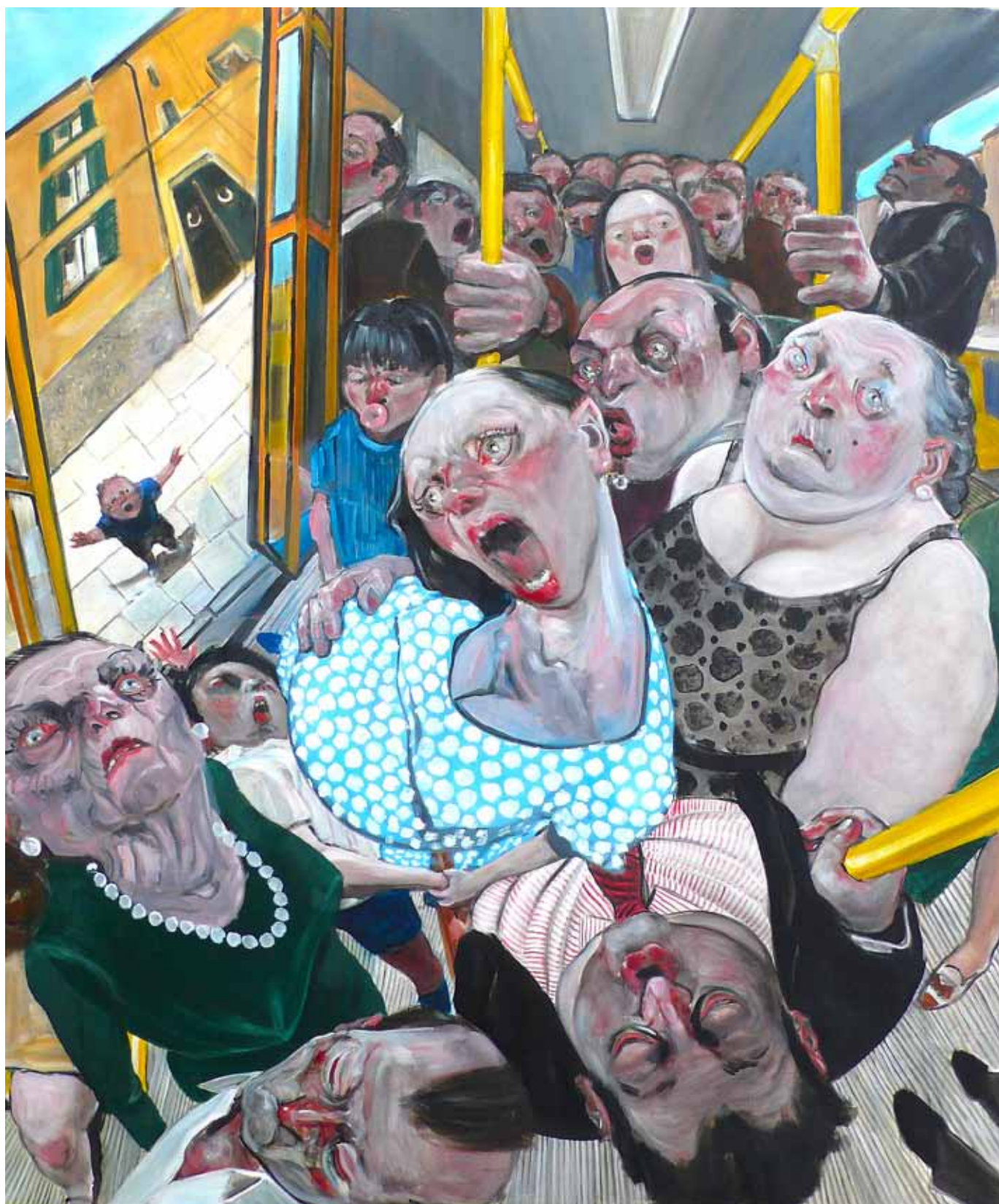
8 Fatemi Scendere oil on canvas 120 x 100 cm (47 x 39 in)