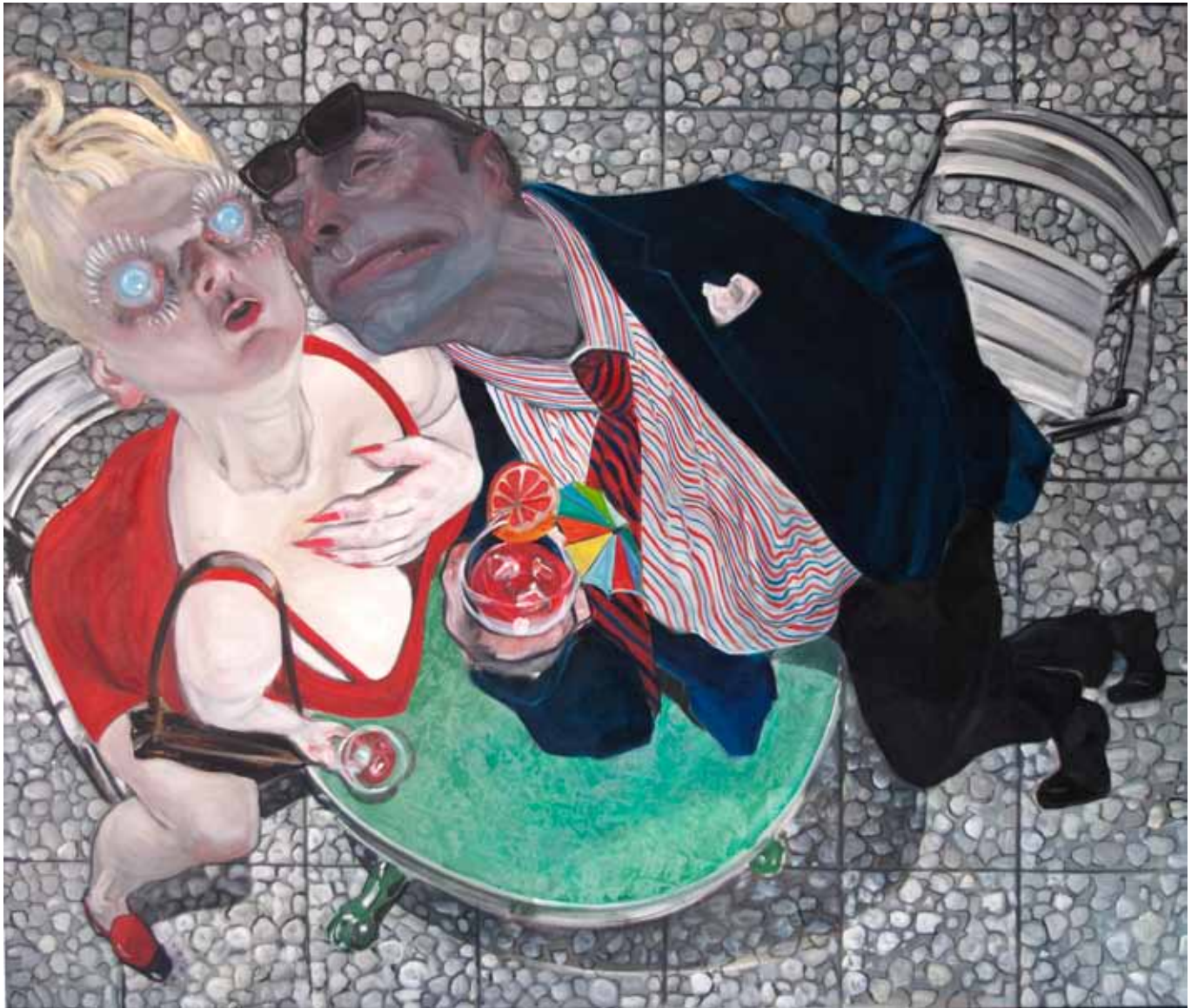
2 Blue Eyes oil on canvas 100 x 120 cm (39 x 47 in)