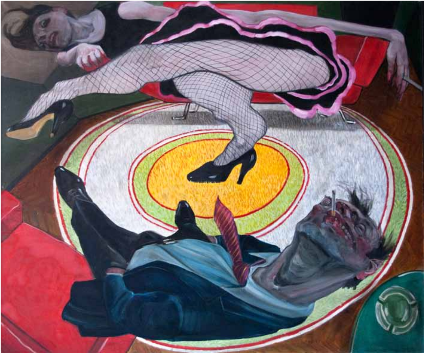
4 La Scosciata oil on canvas 100 x 120 cm (39 x 47 in)