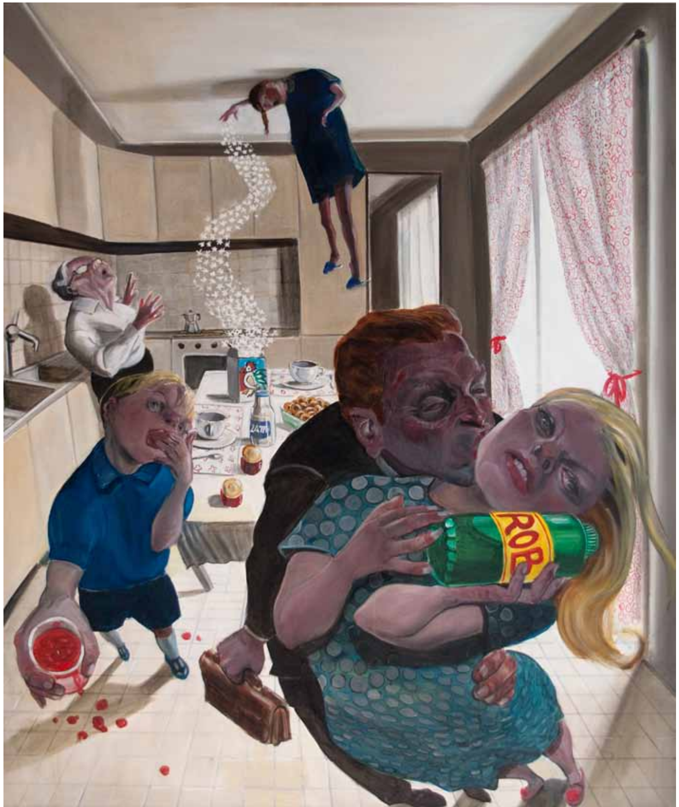
3 Con ROB Ogni Macchia Scompare! oil on canvas 120 x 100 cm (47 x 39 in)