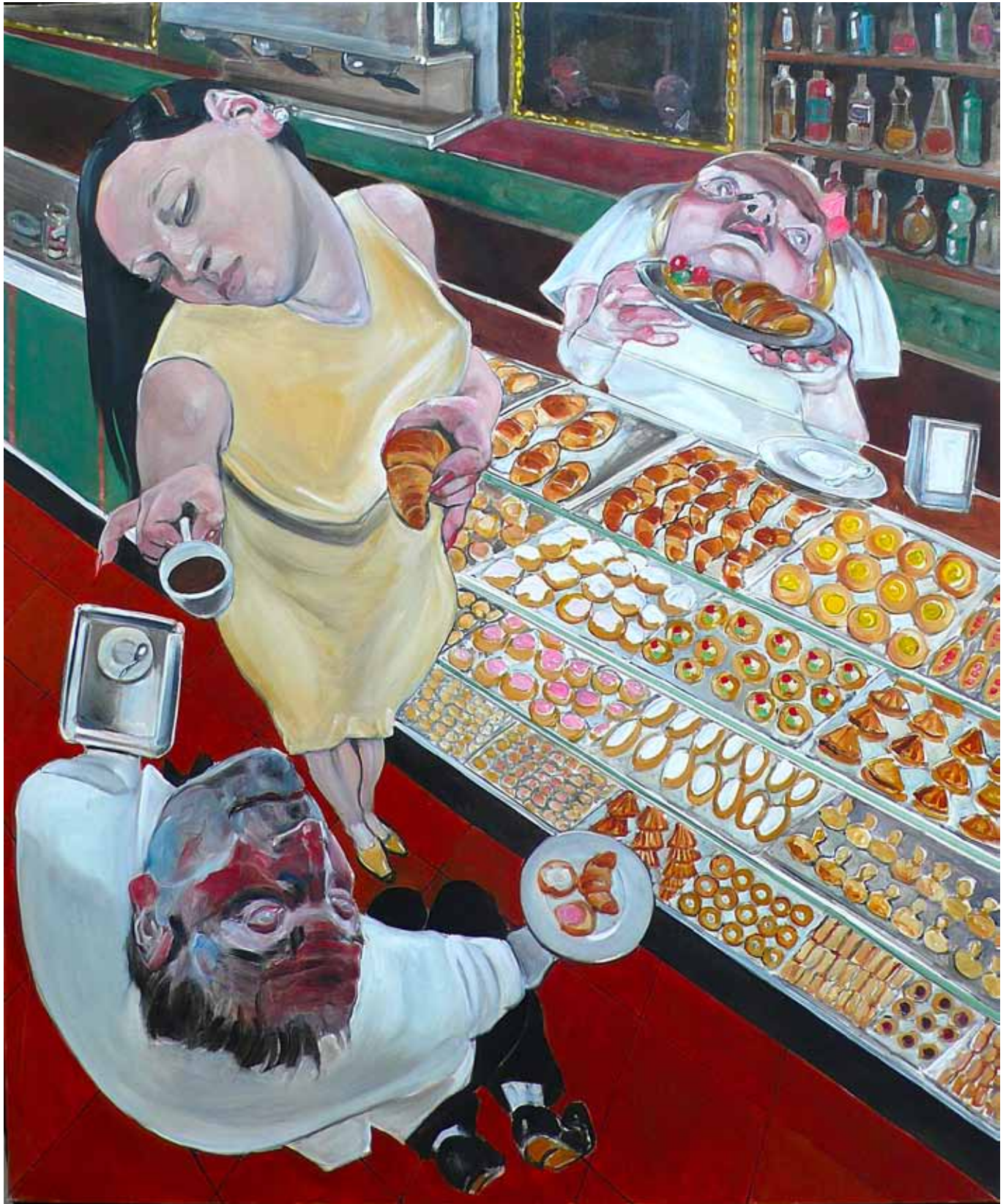
5 La Madonna delle Brioches oil on canvas 120 x 100 cm (47 x 39 in)